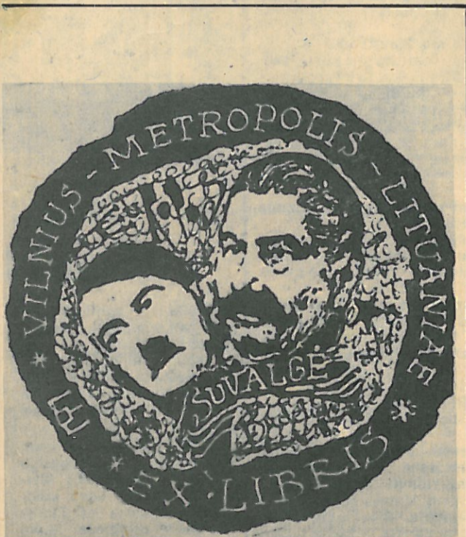
Ar pripažins tai Maskvos komisijs? Klemenso KUPRIŪNO ekslibris.