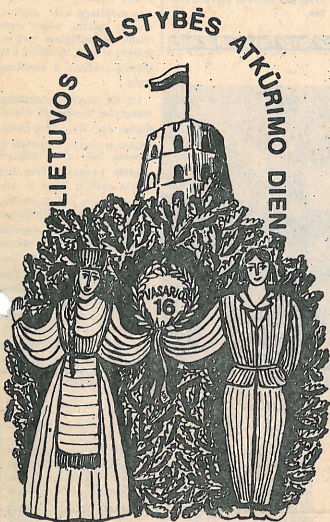
K. MIKULENO pieš.